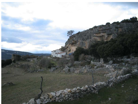
F.1 Vista actual

La extensión en medida usada antiguamente es de tres pares de bueyes, es decir de unas 140 ha. A parte de pastos, bosques y tierra de cultivo se incluyen tres masías y diversas dependencias y complementos agrarios.