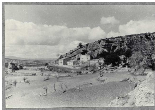
F.2 Vista del conjunto en los años 30 del siglo XX