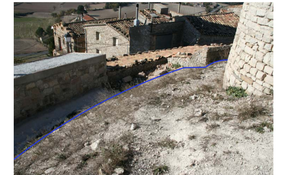
Esplanada davant de l'entrada original