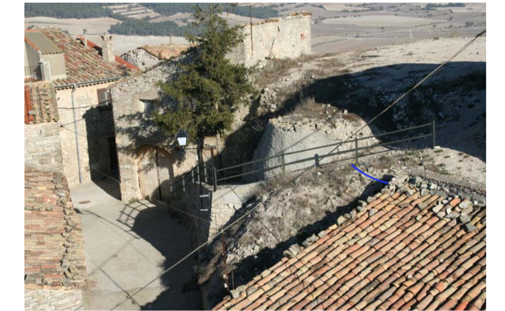
Escalles de l'accés