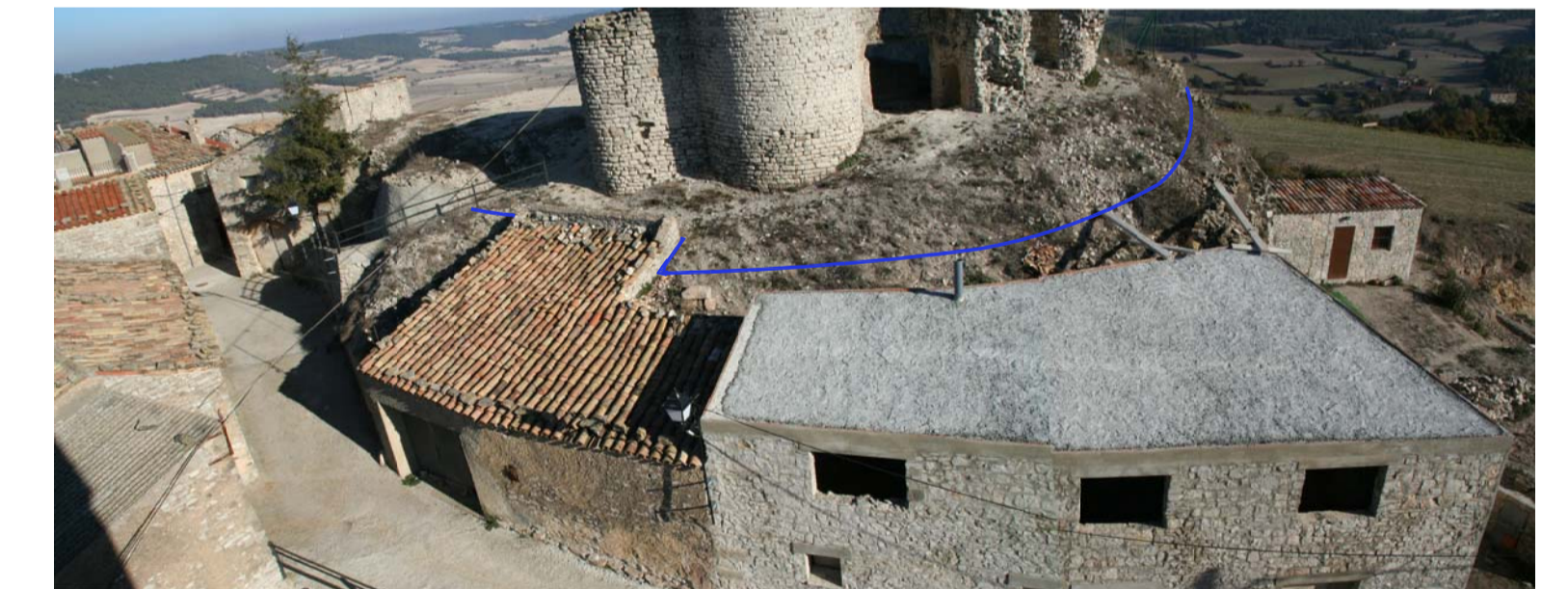
Vista general de l'accés