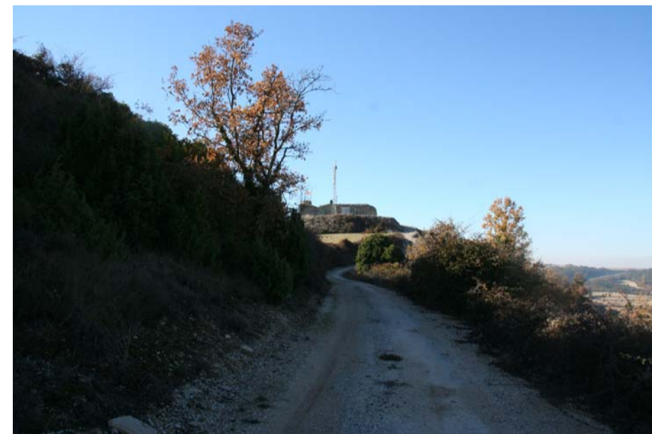
Cami de l'accés amb el castell al fons