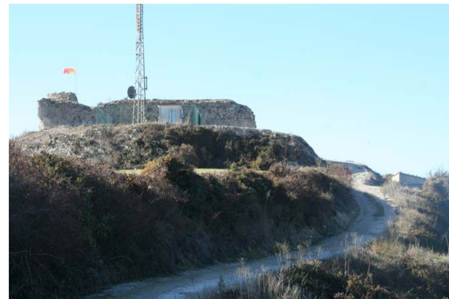
L'accés a peu de castell