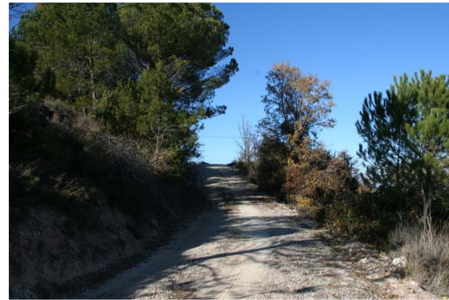
Cami de l'accés